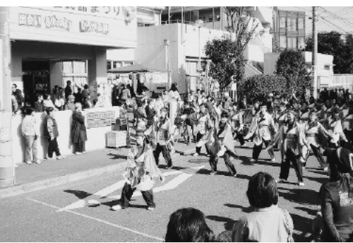
芝久保公民館まつり