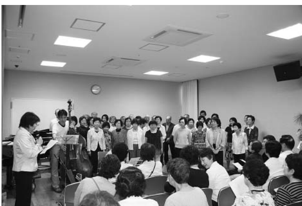
▲コーラスグループによる発表