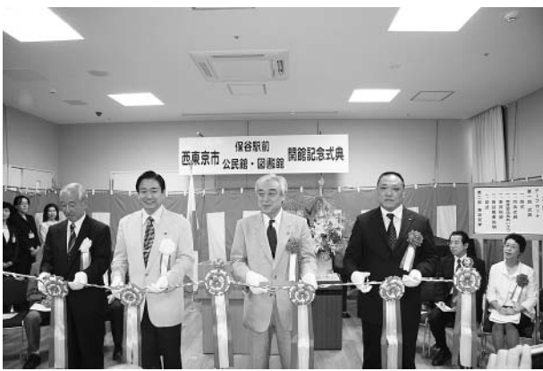
▲開館記念式典テープカット

6月29日(日)10時から開館記念式典が開催され、市長、市議会議長、教育委員長、特定建築者の4名でテープカットが行われました。 午後は、コーラスグループ7団体295人による発表会が催されました。会場には多くの市民の方々が集まり、熱気に包まれた希望と感動いっぱい時間を過ごしました。