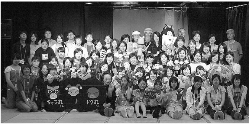
▲人形劇フェスタ スタッフ

来年度の開催に向けて、準備会を開催します。人形劇を演じたいと思う方や、お手伝いして下さる方、その他興味のある方々のご参加をお待ちしています。 子どもたちに楽しいひと時をプレゼントするため、ぜひ、あなたの力をお貸しください。 ▼とき 10月9日(木) 14時～16時 ▼ところ 田無公民館 ▼問合せ先 田無公民館