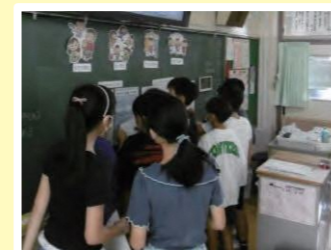
あんけーと アンケートの様子

とくしゅうごう つく この特集号を作るために、9月に出張授業 がつ しゅつちょうじゅぎょう で い 行った市内4か所の小学校で、400人以上の子 しな ども にんいじょう たちにアンケートに協 きょうりよく 力 りき してもらいました。 ご協 きょうりよく 力 りき どうもありがとうございました！