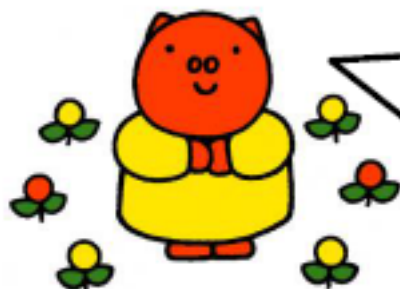
Illustration Dick Bruna, Copyright Meris bv, 1977

親切に指導しますのでお気軽にご相談下さい♪ 駅近くなので、仕事帰りの買い物も楽々♪