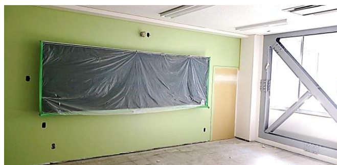
3階のアクセントカラーはブルー、2階はグリーンと、カラフルな内装になりました。