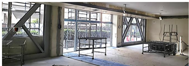
1階ロビーの一部(写真右側)が学習コーナーとなります。