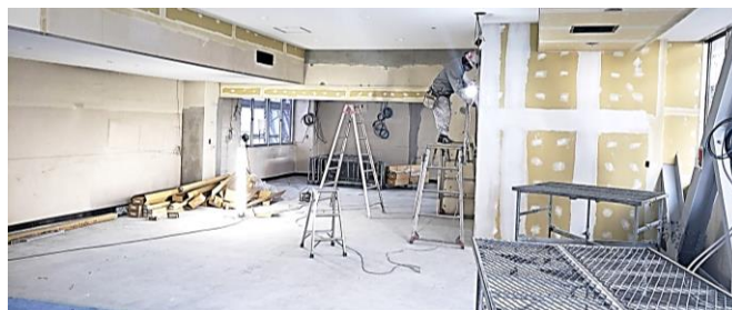
1階 旧事務室の一部(写真下側)がロビーとなります。