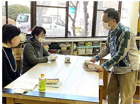
刑事の指示により、当時の状況を再現しています。この後どんな展開になるのでしょうか。