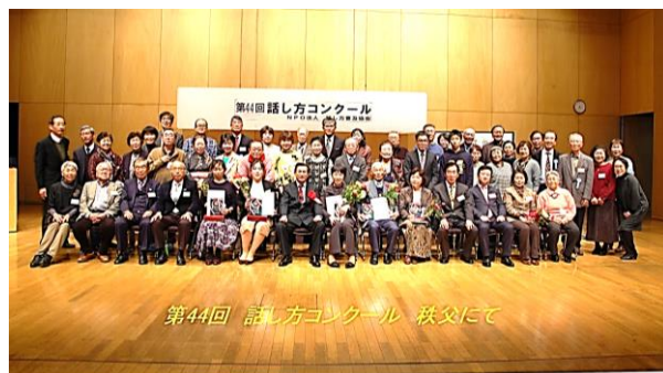
第44回 普及協会 話し方コンクール（秩父にて） 各団体が集合して盛り上がりました。