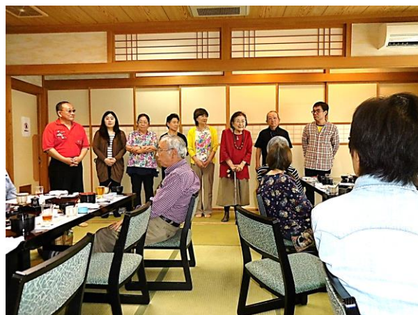
深緑会、普及協会、各団体が集まり、田無話し方の会がメンバーの紹介をしました。