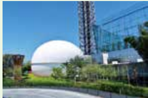
多摩六都科学館 Tamarokuto Science Center