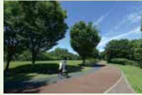
西東京いこいの森公園 Nishitokyo Ikoinomori Park