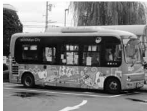
はなバス Community Bus (Hana Bus)

“花巴士”在没有开通公交线路和电车的区域运行。采用统一车费，大人150日元、小孩100日元(还没上学的儿童免费)。可以使用PASMO、Suica等交通IC卡。不出售普通的回数券。75岁以上的西东京市民可购买“敬老回数券”(150日元卡×10张合计1000日元)。