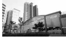
ひばりヶ丘駅北口 Hibirigaoka Station North Exit

‘하나 버스’는 노선버스와 전철이 통행하지 않는 곳을 운행하고 있습니다. 요금은 어른 150 엔, 어린이 100 엔(취학 전 아동은 무료)으로. 파스모(PASMO), 스이카(Suica) 등의 교통계 IC카드를 이용할 수 있습니다. 일반 회수권은 판매하지 않습니다. 75세 이상의 니시도쿄 시민은 ‘경로 회수권’(150엔권×10장에 1,000엔)을 구매할 수 있습니다.