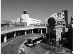
保谷駅南口 Hoya Station South Exit