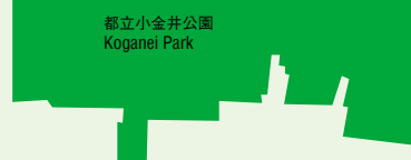
都立小金井公園 Koganei Park

狭山・境線道 (多摩湖自転車歩行者道) Sayama-Sakai Ryukudo Pass (Lake Tama Bicycles and Pedestrians Road)