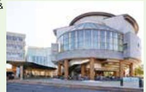
保谷こもればいホール Hoya Komorebi Hall