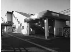
東伏見駅南口 Higashi Fushimi Station South Exit