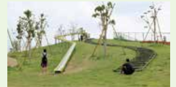
都立東伏見公園 Higashi Fushimi Park